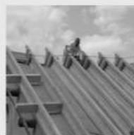
Toiture en poutres en I