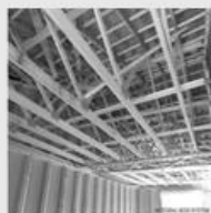
Charpente industrialisée en bois

Télécharger tous les documents de Charpente