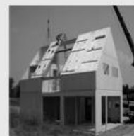
Toiture en panneaux de bois lamellé-croisé (CLT)