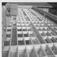
Toiture-terrace éléments porteurs bois

Sur 2019 des demies-journées techniques (2 sessions sur cinq villes) seront organisées en régions (Rumilly, Nantes, Epinal, Paris, Bordeaux).