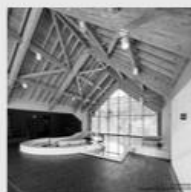
Charpente en bois