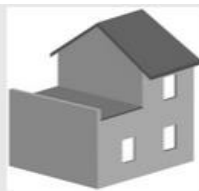
Fiche Famille CHARPENTE

Télécharger tous les documents de Charpente