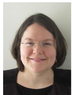
Florence Banner Institut Technologique FCBA Bordeaux, France